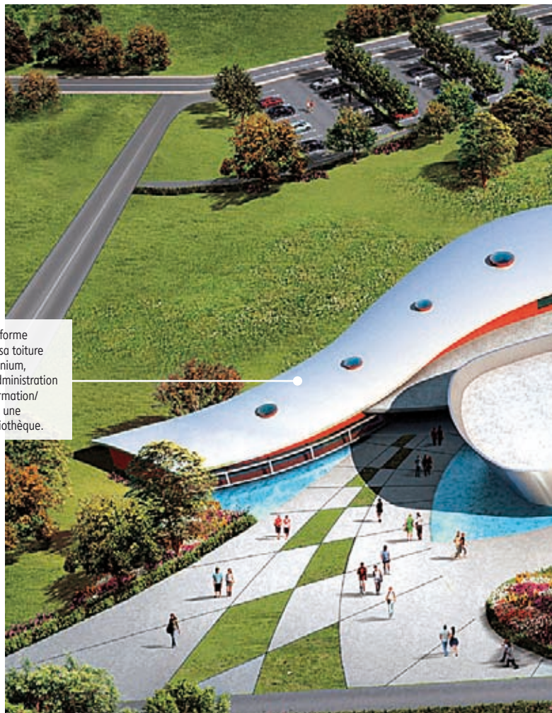
Le bâtiment en forme de vague, avec sa toiture habillée d'aluminium, rassemblera l'administration et l'interface formation/entreprise, avec une importante bibliothèque.

« L'équipe pédagogique de la formation a été associée de près à la conception du projet. Nos besoins ont été pris en compte, particulièrement les principales activités d'une école d'ingénieurs : d'un côté enseignement et de l'autre la recherche et l'innovation. Ce qui caractérise cette création, comme le bâtiment de l'IUT conçu par le même architecte, est l'utilisation de lignes courbes qui peuvent heurter les esprits cartésiens mais qui à l'usage apportent un confort de vie évident. »