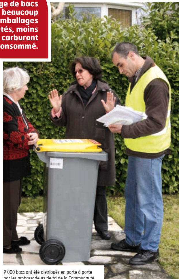
9 000 bacs ont été distribués en porte à porte par les ambassadeurs de tri de la Communauté.