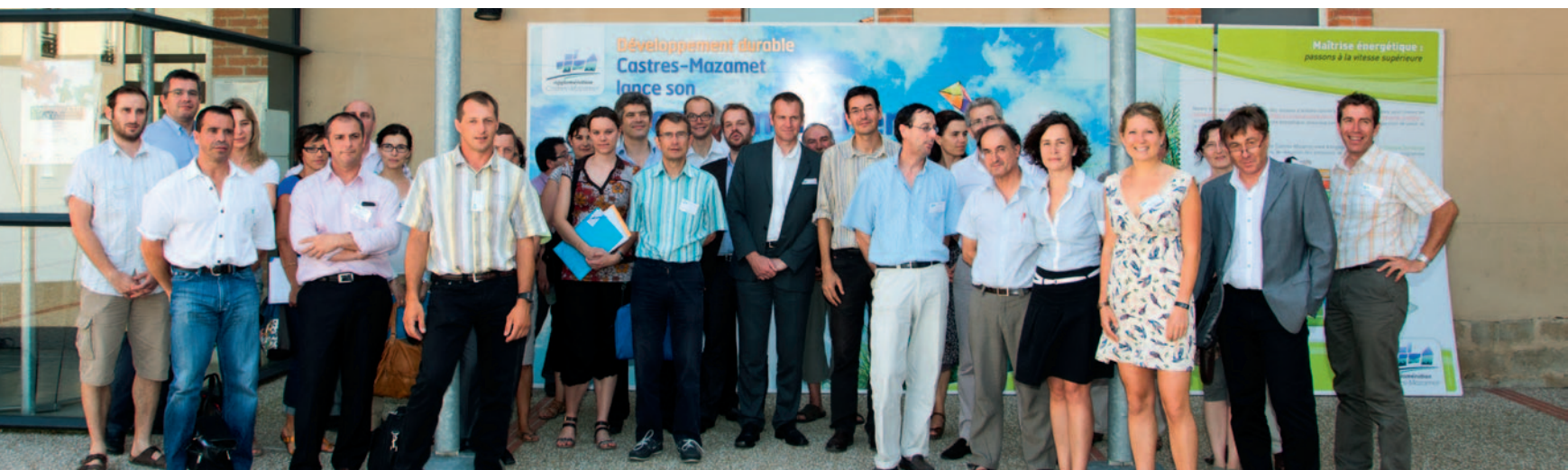
Les participants aux journées de concertation ont débattu pour préparer le plan d'action.