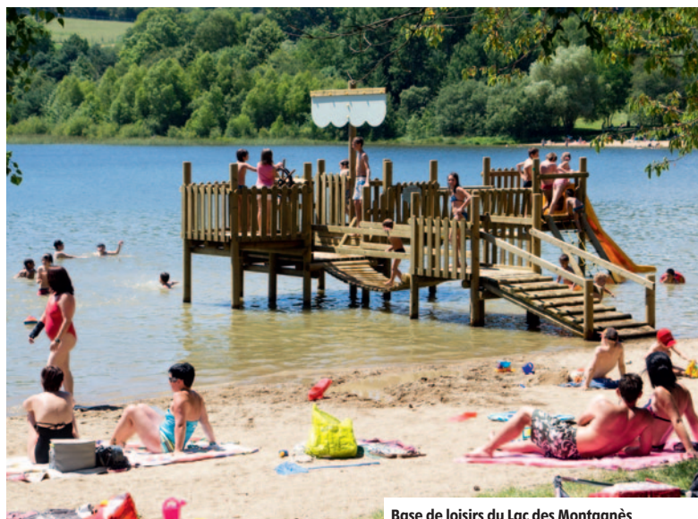
Base de loisirs du Lac des Montagnès à 10 min de Mazamet sur la route de Carcassonne.